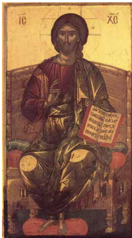
„Fără Mine nu puteți face nimic”

Deci și la nivelul formei, și la nivelul conținutului sunt ispite care-l pot abate pe om într-o părută evlavie, care, de fapt, nu este corectă și