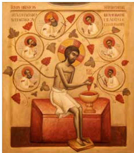
Sfinții Brâncoveni (Elena Murariu)

ortodocși, suntem însă cei mai progresiști dintre toți, de fapt, pentru că noi căutăm progresul nesfârșit în plan spiritual, moral, emoțional și intelectual prin unirea în veșnicie cu Dumnezeu cel viu, Iubitor și Nemărginit. Iar trăirea lui Dumnezeu în Biserica Sa Dreptmăritoare ne dă și nouă, prin gustarea acelor experiențe înalte ale iubirii și cunoașterii, tăria și statornicia în credință și în mărturisire publică.