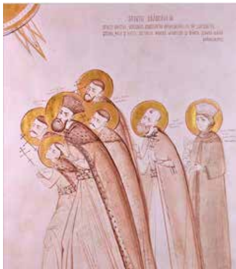
Sfinții Brâncoveni, cununie (Elena Murariu)