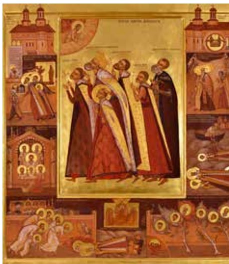
Sfinții Martiri Brâncoveni mlădițe (Ioan Popa)

Avându-i modele și ocrotitori pe Sfinții Brâncoveni și, totodată, pe toți Mucenicii (mai ales pe cei din temnițele comuniste, cei mai apropiați temporal și spațial de noi), și rugându-ne lor, să avem curaj și fermitate în viața noastră cotidiană plină de încercări și viclene prigoniri, căci suntem împreună cu Domnul Iisus Hristos, Dumnezeu cel viu, Creatorul și Mântuitorul nostru, Care ne-a spus: „Îndrăzniți, Eu am biruit lumea” (Ioan 16, 33) și „Eu sunt cu voi în toate zilele până la sfârșitul veacului. Amin.” (Matei 28, 20)